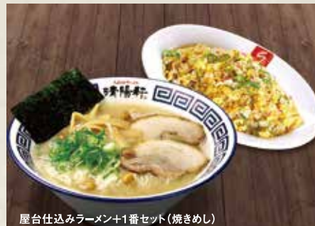
屋台仕込みラーメン+1番セット(焼きめし)

昭和二十七年創業の伝統の味。国産の豚骨だけを使い、丸3日間かけて作り上げる、一切雑味のない豚骨スープ。上質なスープにこだわりの自家製麺を絡めて、豚骨本来の旨みを十分に堪能いただける極上のとんこつラーメンです。