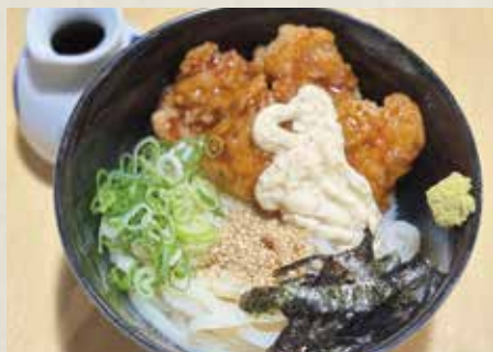
ベトナム風テリヤキ鶏タルぶっかけうどん

久留米市大善寺町で「全国のオーナーシェフが選ぶ絶品グルメどんぶり部門」で金賞受賞した「金賞カツ丼」先日うどんMAP2代目で紹介された「極上のチャーシューうどん」が当店イチオシ!