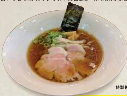
特製醤油らーめん

生産者直営のらーめん店です。こだわりの細麺は自家製麺で、トッピングの海苔も自家製海苔を使用しています。もともととしたコシのある食感の麺は、豚骨を15時間煮込んだスープと相性バツグンです。特製醤油らーめん始めました。