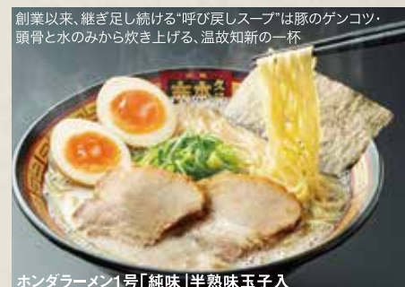
ホンダラーメン1号「純味」半熟味玉子入

継ぎ足し続ける「呼び戻しスープ」に、強いコシが自慢の「自家製麺」とやわらか「自家製焼豚」。これぞ『王道』と呼ぶにふさわしい「久留米とんこつ」。