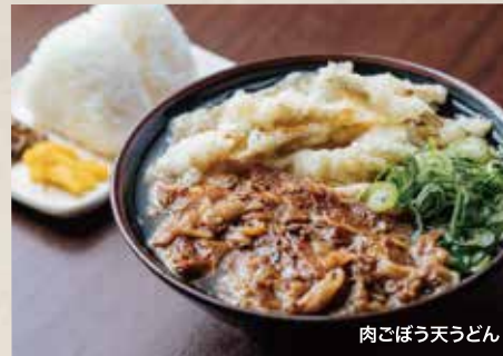
肉ごぼう天うどん

"立花うどん"の麺は中太。「100%釜揚げの麺」にこだわります! 表面はふわっと中はもちもちの食感が楽しめる麺です。ダシ昆布は利尻の浜指定の昆布を1年以上寝かせて使用します。一切の妥協をせずクセをつくらず毎日でも食べられるような飽きの来ないダシ作りを心がけています。