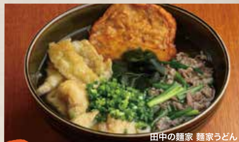
田中の麺家 麺家うどん

1948年創業以来、原料や製法にこだわり続ける田中製麺が2015年7月にオープンした「田中の麺家」。田中製麺を体験する場として多くのお客様にご来店いただいております。麺家うどん、丸天うどん、かしわうどん等の年間メニュー 季節メニューとしてしなそば・塩らーめん・醤油らーめん等おすすめ。飲食された商品が購入できる売店もご愛顧いただいております。お持ち帰り商品もラインナップして皆様のご来店をお待ちしております。