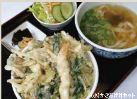
(小)かきあげ丼セット

鰹節、うるめ鰯、鯖節、昆布、宗田節、しいたけをブレンドして取るダシが味の決め手のうどんを提供しています。おすすめは、うどんにご飯や天ぷら盛り合わせなどを組み合わせたセット。金額もボリュームも大満足です。