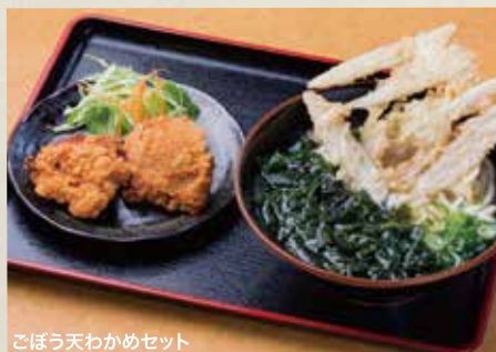
ごぼう天わかめセット

3日間熟成した自家製麺を圧力釜で茹でたコシのあるモチモチ麺。その麺にしっかり絡み付くこだわりの出汁は厳選された素材をふんだんに使い風味ある豊かな味わいになっています。ジュシーでカリカリな唐揚げもオススメです。